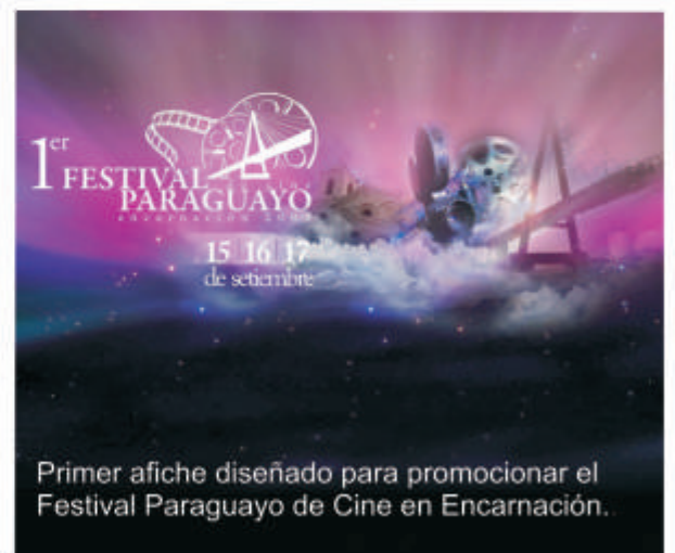
Primer afiche diseñado para promocionar el Festival Paraguayo de Cine en Encarnación.