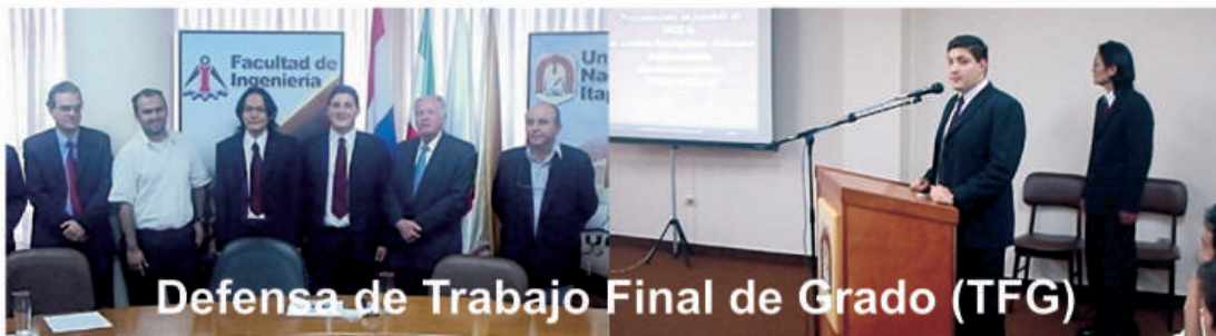
Defensa de Trabajo Final de Grado (TFG)

Video en Color de Resonancia Magnética", en el marco del CACIC 2009 (Congreso Argentino de Ciencias de la Computación), que se llevará a cabo desde el 05 al 09 de octubre de este año, en la Provincia de Jujuy - Argentina. Cabe destacar que la mencionada docente, hará la exposición en representación de la FIUNI.