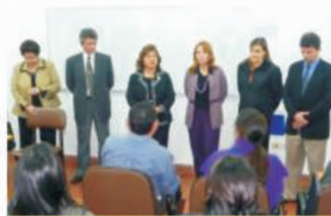
Momento que se dio apertura al curso de Maestría y Doctorado en Educación, organizado por la Facultad de Humanidades

Con una muy buena cantidad de participantes, en la tarde del viernes 7 de agosto, en el Campus de la Universidad Nacional de Itapúa, se dio inicio al curso de Maestría y Doctorado en Educación que organiza la Facultad de Humanidades Ciencias Sociales y Cultura Guaraní y la Escuela de Posgrado de la UNI.