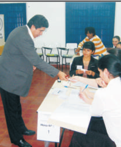
El Encargado del Decanato depositando su voto en la Elección.